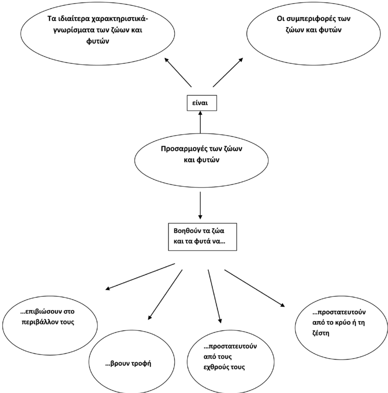
Σχήμα 1: Εννοιολογικός χάρτης